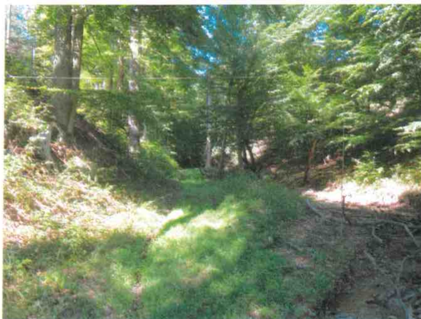
Obr. č.1 Pohľad na profil terénu v mieste hrádze v doline vysychajúceho toku Sakova.

Malá vodná nádrž „SO 9 Sakova“ s akumulačným objemom vody 2511 m 3 je umiestnená na toku Sakova v údolnici jelšovo-hrabového a bukového lesného porastu neovulkanickými horninami a vulkanickými brekciami, priepustnými neogénnymi horninami v podloží. Nádrž je umiestnená na toku s upraveným lichobežníkovým korytom potoka na vtoku a výtoku. Spevnenie toku je dimenzované na bezpečné prevedenie Q_{100}=5,5 \text{ m}^3 \cdot \text{s}^{-1} . Kamenno-betónová hrádza má tvar lichobežníka a koruna hrádze šírky 1,2 m dosahuje max. výšku na teréne 5 m. Sklony stien drieku hrádze sú 5:1. Hydroizolácia je tvorená kaučukovou EPDM fóliou hrúbky 1,5 mm s vrchnou ochranou kamennou dlažbou na príľahlom dne a svahu celkovej šírky 5,8-6,7 m so zakončením múrika 500 x 500 mm na dne. Na vtoku do VN je spevnené koryto potoka kamennou rovinou hr = 200 mm dĺžky 5 m a šírky 10 m.