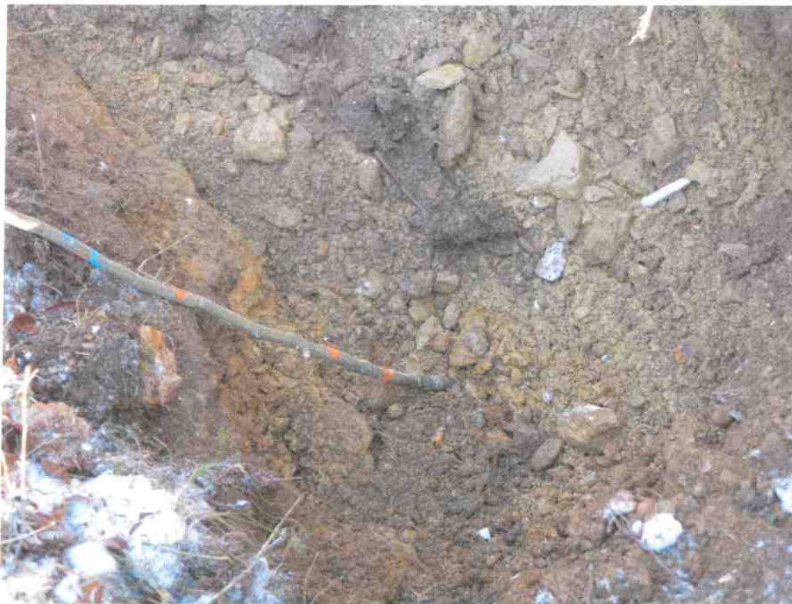
Obr. č.2. Ílovito - hlinité podložie tvorí nadložie so štrkovým zahlineným laviciam.